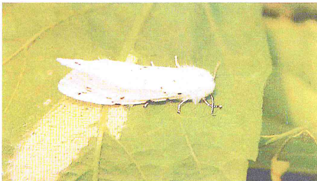
Adulto femmina di Hyphantria C. durante l'ovodeposizione.

I bruchi, raggiunta la maturità (in un mese circa) si mettono alla ricerca di adatti ricoveri: nel terreno, in un anfratto di tronco d'albero, in crepe nei muri, sotto le tegole delle abitazioni, per incrisalidarsi e svernare (larve della II generazione).