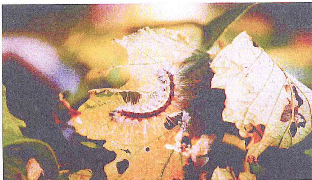
Larva di Hyphantria Cunea

Al centro - sud o nelle isole, si potrebbe anche giungere a tre generazioni l'anno.