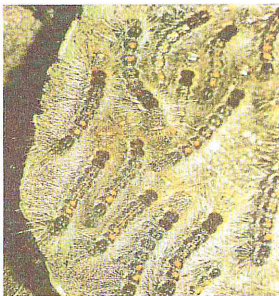
Giovani larve di E. Chrysorrhoea

Danni: le larve nascono e divengono attive nel pieno dell'estate, dalla fine di luglio alla metà di agosto. Hanno colore bruno nerastro, sono dotate di setole biancobruno (dalle proprietà urticanti) e sul dorso sono provviste di tubercoli color arancio. Ai lati del corpo si notano delle striature longitudinali bianco - arancio. Le larve manifestano tendenze gregarie. Le foglie delle piante ospiti (quercia, tiglio, acero, pioppo, carpino, rosacee e fruttifere varie) vengono ridotte alla sola nervatura. L'attacco determina dunque diffuse defogliazioni delle specie vegetali attaccate, che subiscono indebolimento e predisposizione ad altre malattie. Le modalità di lotta sono analoghe a quelle per Hyphantria Cunea .