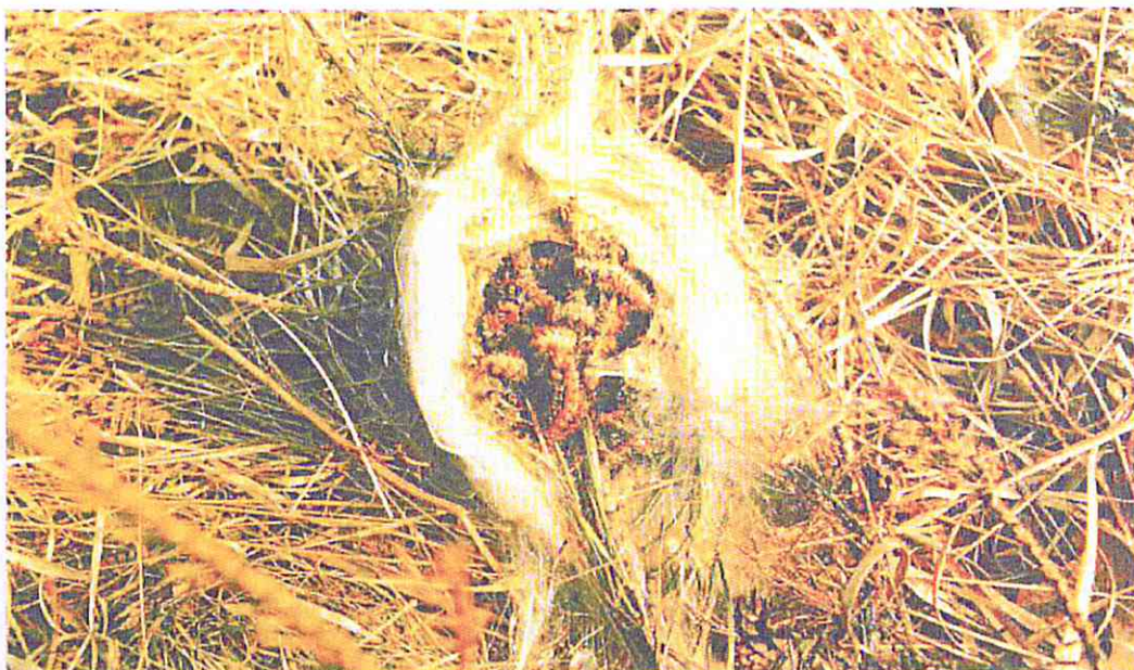
Nido aperto colmo di larve di processionaria del pino.

La processionaria è un insetto appartenente all'ordine dei Lepidotteri, le comuni farfalle. Durante gli stadi larvali (bruchi) le processionarie sono fitofaghe; si alimentano cioè delle parti verdi delle piante, provocando defogliazioni, indebolimento e blocco dell'accrescimento. Il riconosciuto potere molesto delle larve è dovuto alla presenza su di esse di numerosissimi peli urticanti che possono causare irritazioni e allergie cutanee all'uomo. Le popolazioni di processionaria sono soggette ad ampie fluttazioni cicliche, per cui si succedono periodi con sporadiche e modeste apparizioni a periodi con massicce infestazioni. Ciò avviene ogni 8 - 10 anni. Ci sono due specie di processionaria nella nostra penisola: la processionaria del pino ( Thaumetopoea pityocampa ) e la processionaria della quercia ( Thaumetopoea processionea ). Queste hanno un ciclo biologico diverso e in conseguenza di ciò i trattamenti, che devono essere effettuati sulle larve giovani, cadono per la processionaria del pino in agosto - settembre e per la processionaria della quercia in marzo - aprile.