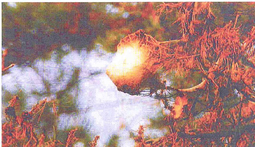
Nido di Thaumetopoea pityocampa.

In entrambi i casi lo scopo sarà quello di realizzare un ambiente sfavorevole ed inidoneo alla vita della processionaria durante il suo ciclo di sviluppo.