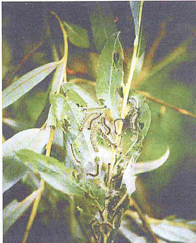
Larve di Hyphantria Cunea

le larve, estremamente polifaghe, provocano defogliazioni a carico di numerose specie, prediligono il gelso e l'acero negundo (che sono i primi ad essere attaccati). Noce, pioppo, platano, salice, tiglio, sambuco sono frequentemente colpiti e, nel caso di gravi infestazioni, anche ippocastano ed olmo, diverse specie di frutteti e di arbusti ornamentali possono essere danneggiati. Danni occasionali e solitamente contenuti si possono inoltre verificare sul finire dell'estate, a carico di coltivi di erba medica, mais e soia, attigui ad alberate intensamente defogliate.